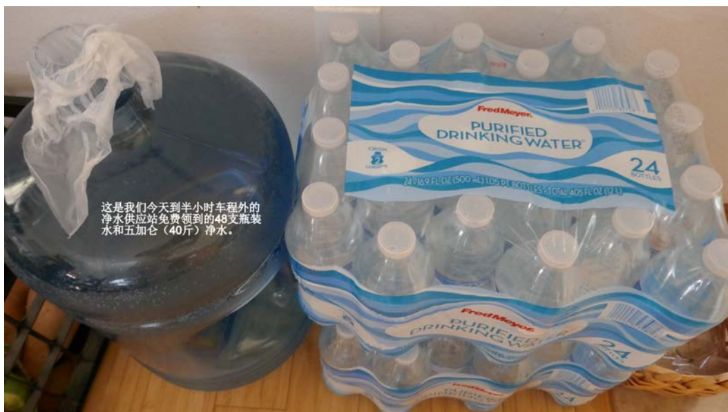
这是我们今天到半小时车程外的 净水供应站免费领到的48支瓶装 水和五加仑（40斤）净水。