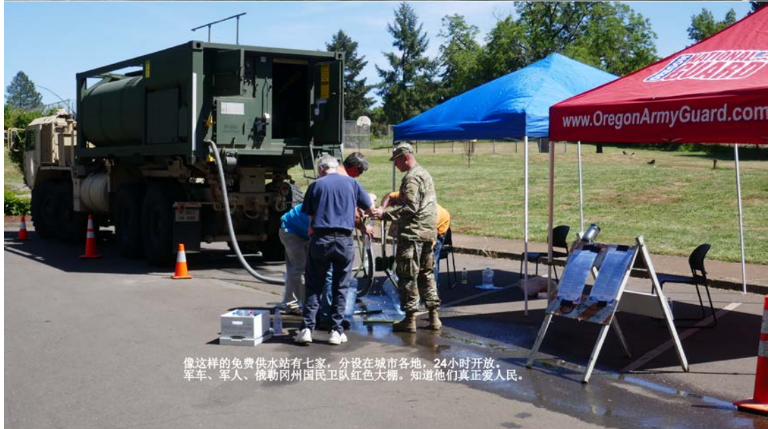
像这样的免费供水站有七家，分设在城市各地，24小时开放。 军车、军人、俄勒冈州国民警卫队红色大棚。知道他们真正爱人民。