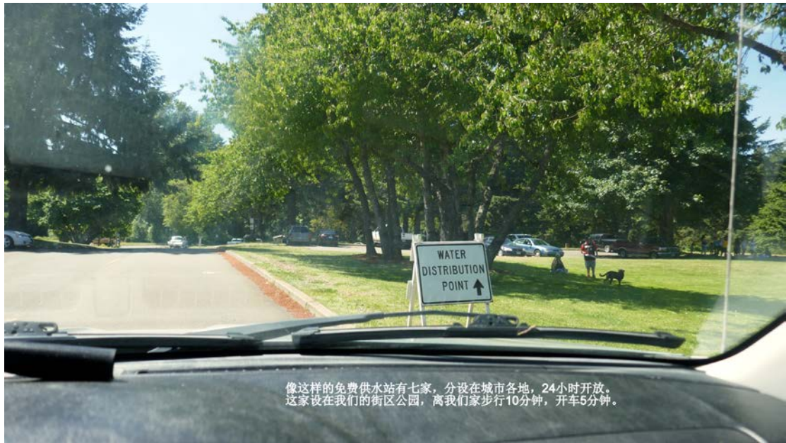
像这样的免费供水站有七家，分设在城市各地，24小时开放。 这家设在我们的街区公园，离我们家步行10分钟，开车5分钟。