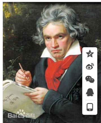
第九交响曲的概述图 (3张)

第九交响曲，是由路德维希·凡·贝多芬作曲，于1823年的年底完成，1824年5月7日，该曲首演于维也纳凯伦特纳托尔剧院。该曲一共四个乐章，一直以来，该组曲被认为是贝多芬在交响乐领域的最高成就。