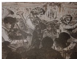
首演场景 Karl Offterdinger 绘于1…