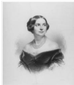
参与首演的的歌手(5张)