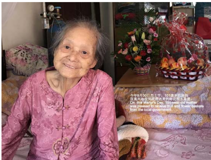
今年9月30日烈士节，101岁的妈妈很高兴地收到政府送来的鲜花和水果篮。 On this Martyr's Day, 101-year-old mother was pleased to receive fruit and flower baskets from the local government.

岁月如斯，愿百岁妈妈知道：我们感恩，我们记住。愿遇难68年的年轻的（37岁）爸爸在天之灵安息。 燕南 题于 2017.10.11