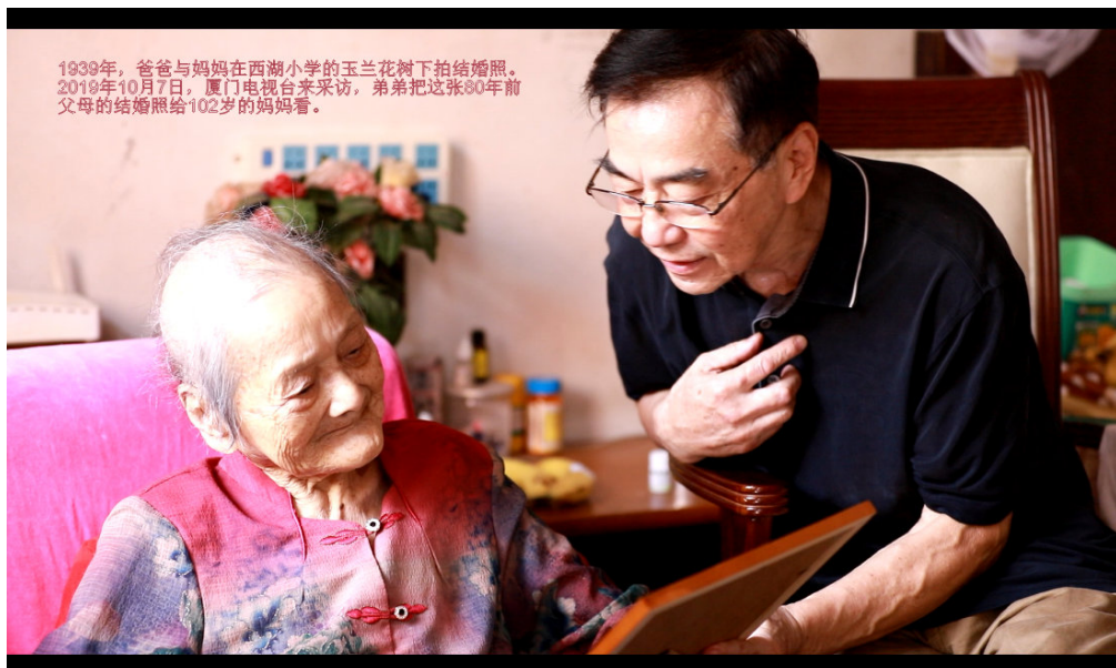
1939年，爸爸与妈妈在西湖小学的玉兰树下拍结婚照。2019年10月7日，厦门电视台来采访，弟弟把这张80年前父母的结婚照给102岁的妈妈看。

岁月如斯，愿百岁妈妈知道。我们感恩，我们记住。愿遇难68年的年轻的（37岁）爸爸在天之灵安息。 燕南 题于 2017.10.11