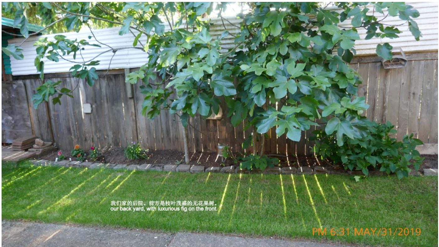
我们家的后院。前方是枝叶茂盛的无花果树。 our back yard, with luxurious fig on the front.