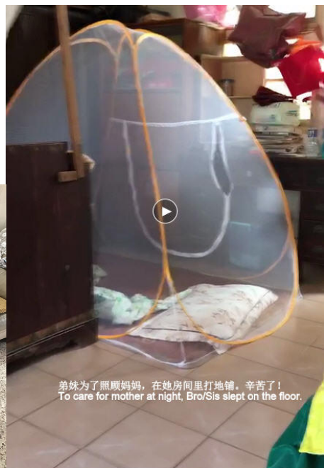
弟妹为了照顾妈妈，在她房间里打地铺。辛苦了！ To care for mother at night, Bro/Sis slept on the floor.