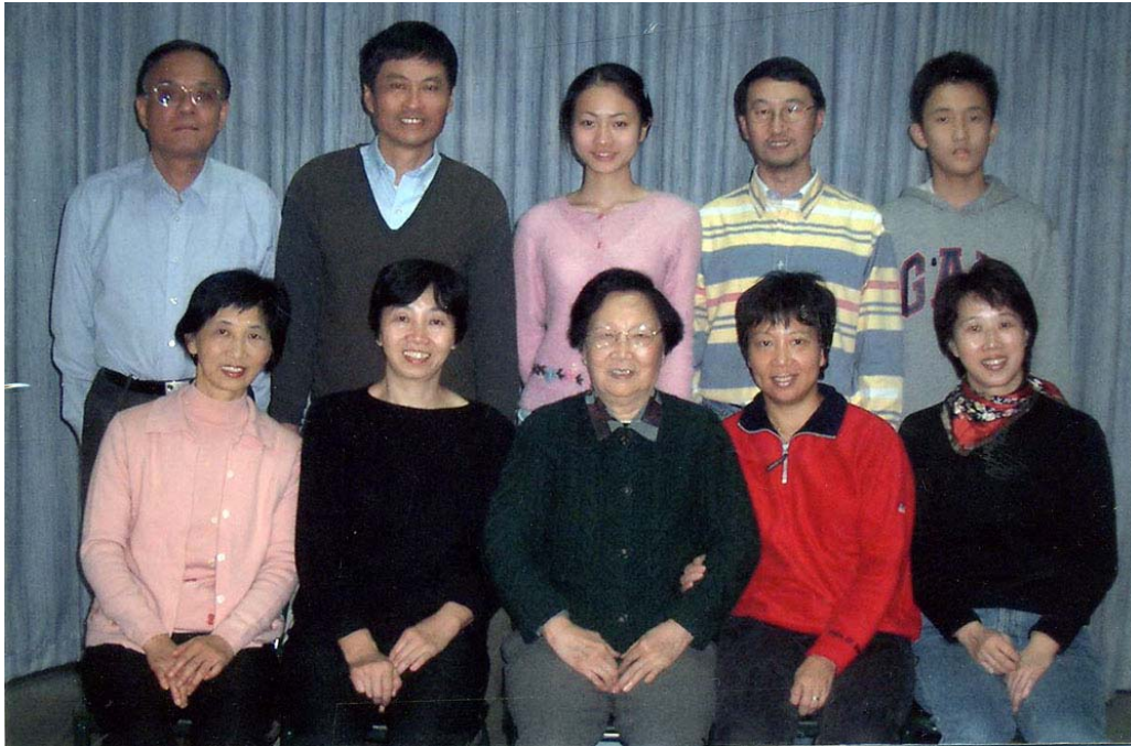
七嬭友徵携子女全家照