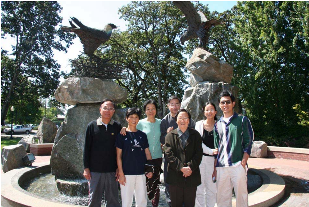
友徵携女兒女婿、孫兒孫媳與麗卿、燕南二〇〇五年在美國留影 ( 更多照片 )