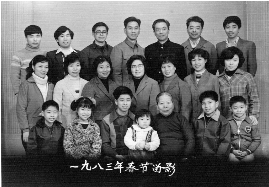
1983 年春節全家相聚廈門