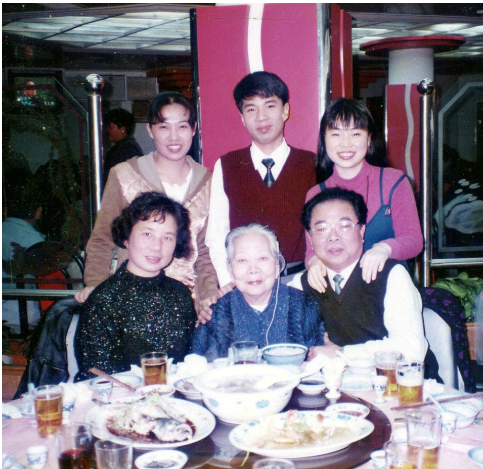
基魯一家人與母親在一起