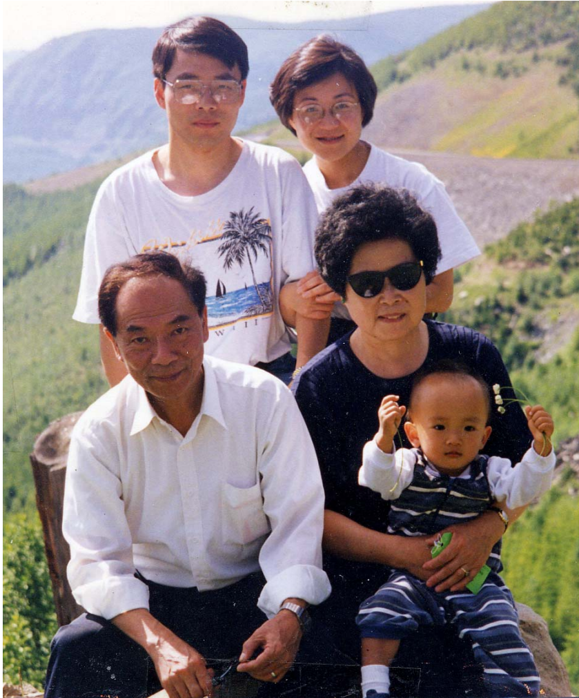
基鑄夫婦二〇〇〇年來美國看望兒子媳婦和孫子

基鑄生于 1933 年，卒于 2003 年，享年 70 歲。1951 年畢業于廈門集美航海學校。1955 年考入上海交通大學，畢業后在西安電控廠工作，后任西安低壓電器廠廠長，西安僑聯理事，西安南僑公司董事長，第四屆全國僑聯大會代表。退休后定居上海，2003 年病逝，墓葬上海青浦。