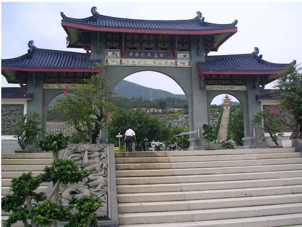
廈門同安區“廈門安樂園” 正門