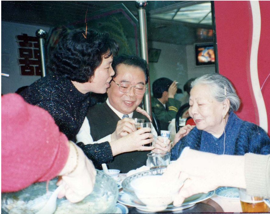
基魯、一真給母親敬酒