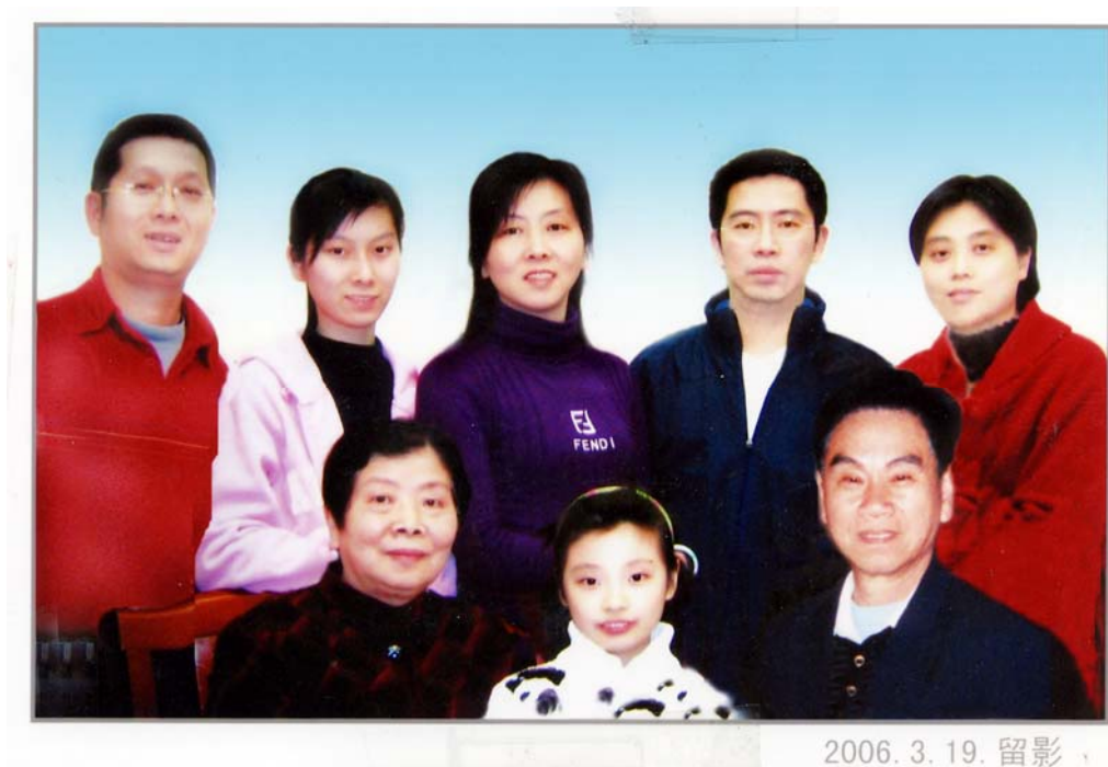
二〇〇六年三月麗珍天亮家合影