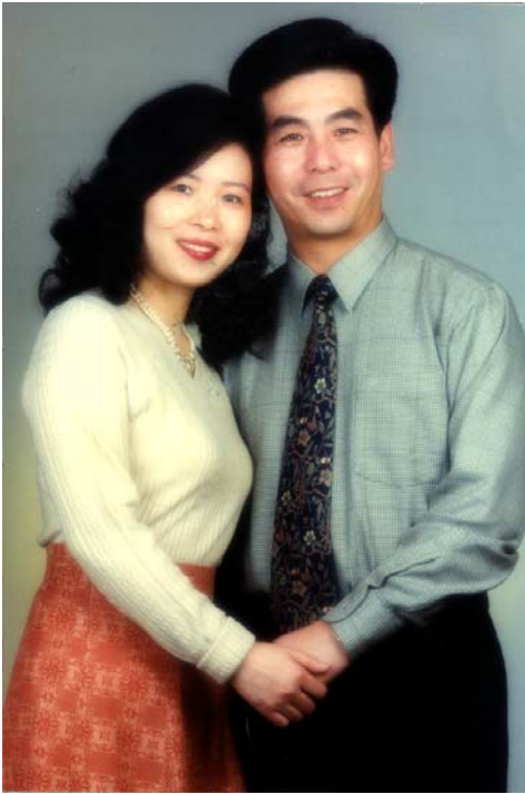
于蘭與夫婿攝于上海