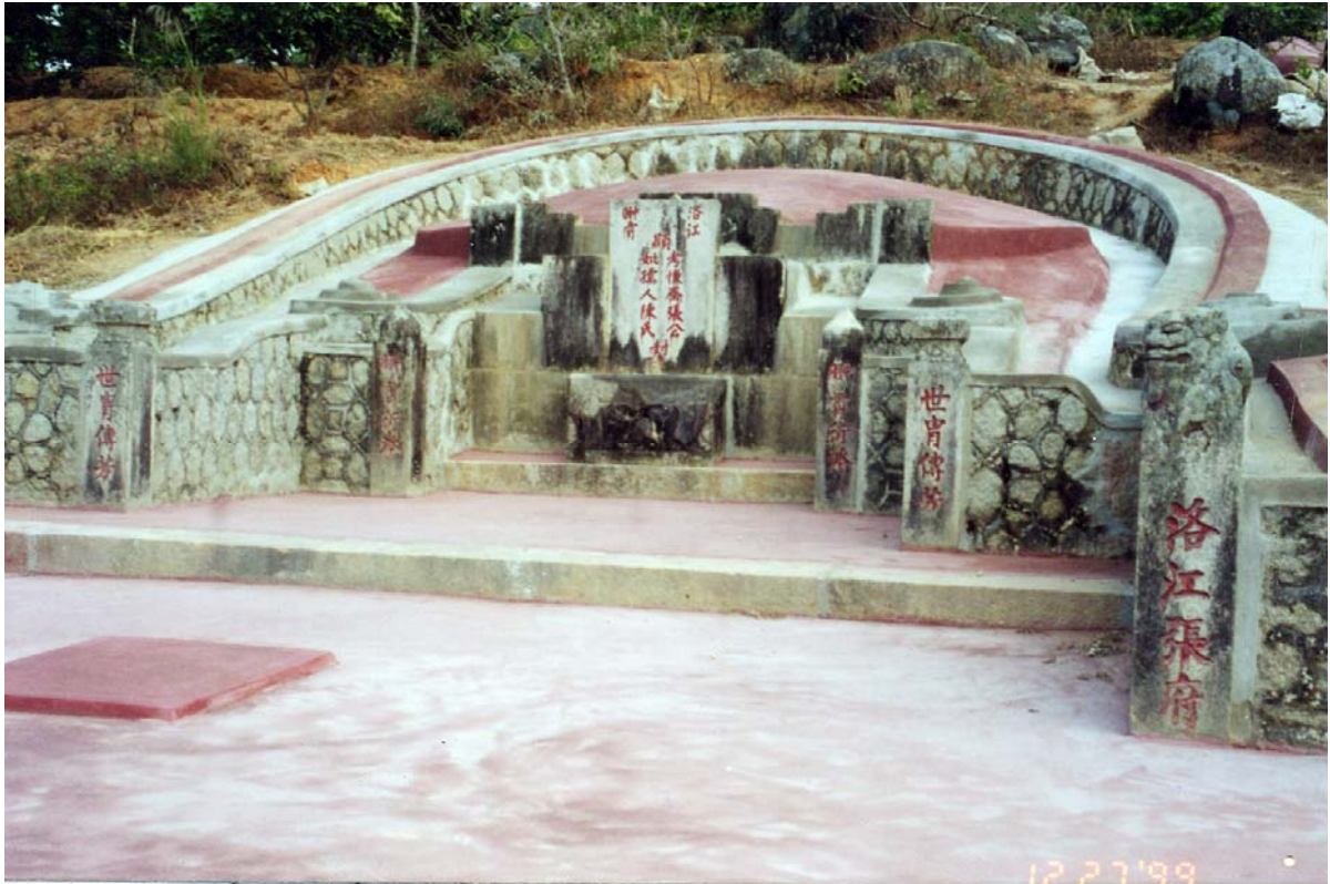
先主仰瑜公妣陳氏墳墓 1943 年建

張家人多業大，多人為朝廷官吏，享皇朝奉祿，遵孔孟之道，家教嚴格，人員等級輩份分明。當時全家 100 多人合在一起吃飯，各房媳婦輪流煮飯，用餐需分三批：第一批為長老、父子、孫輩；第二批為婆婆、姑嫂；第三批為媳婦們及親屬婦女輩份。用餐時只能一次夾菜，不得重復二次夾菜，一般只夾面前的菜，不得跨越夾菜。這些封建禮數倒也帶給張家子孫尊老敬老，孝順父母，妯娌和睦相處的優良傳統。