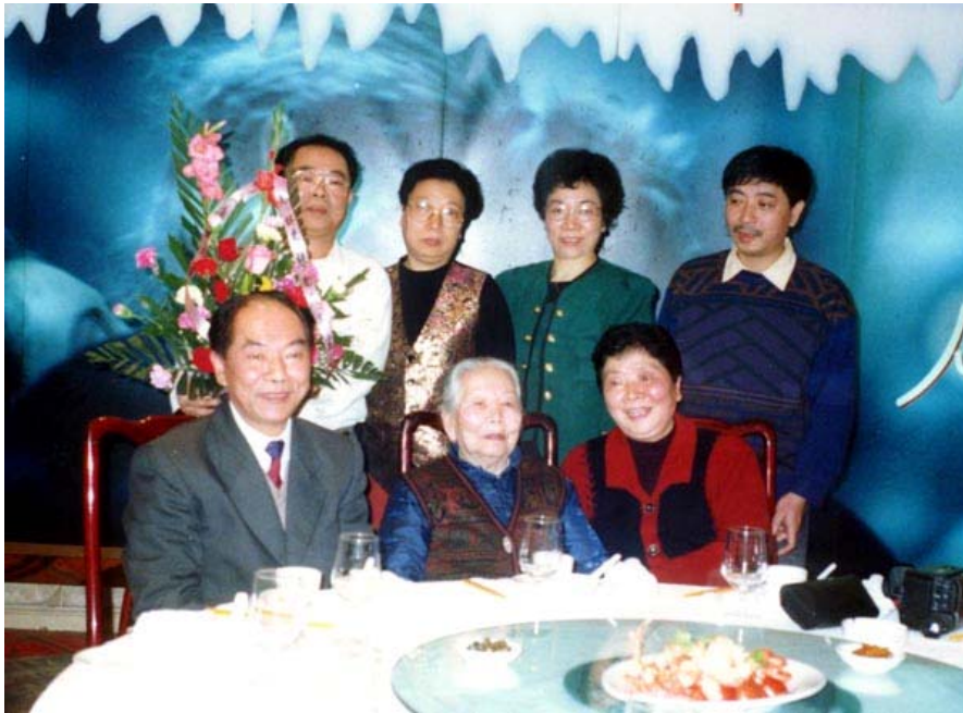
一九九九年十二月二十五日攝于母親九十一歲生日