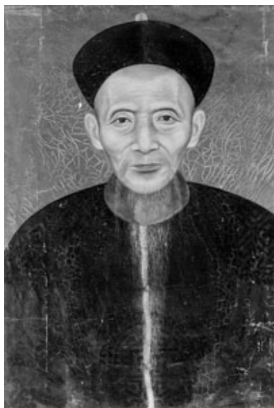
宗澍公，字雨沂。洛陽翀霄張氏第九代

宗澍公，字雨沂。洛陽翀霄張氏第九代。生于清朝道光乙未年，卒于清朝光緒乙未年(1835----1895)，享年61歲。