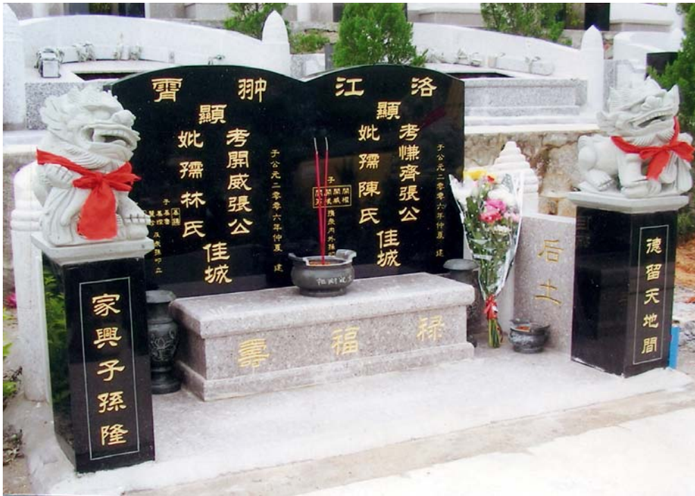
先主仰瑜公、妣陳氏墓及子開威、媳索琴墓于二〇〇六年移至廈門同安區“廈門安樂園”