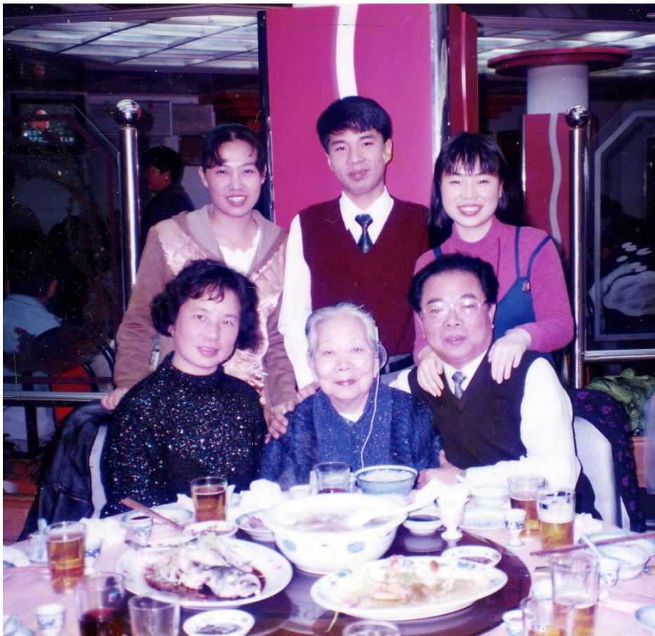
基魯一家人與母親在一起